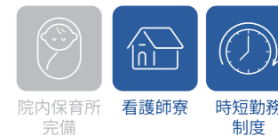
院内保育所 完備 看護師寮 時短勤務 制度

八重山の人が健康に暮らしていけるよう、八重山病院はその理念「地域と共に、八重山の医療を守ります」の言葉の通り、地域の皆さまと共にあり、総合病院として全科をあげて安心して安全な最良の医療を持続的に提供できるよう力を尽くしています。