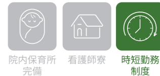
院内保育所 完備 看護師寮 時短勤務 制度

県立病院唯一の精神科単科病院であり、県下精神科病院で唯一の結核病床を備えた病院です。「こころ病む人を支え共に歩む」を常に念頭に置き、患者さんの訴えに耳を傾け、寄り添いながら県立病院としての役割を果たせるよう職員一丸となって取り組んでいます。