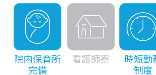
院内保育所完備 看護師寮 時短勤務制度

「断らない救急医療」を目指し、24時間いつでも受け入れができるよう、入退院支援室を立ち上げ、効率的なベッドコントロールを行っています。また、地域の訪問診療や病院、施設と連携し、退院後の在宅療養支援に取り組んでいます。