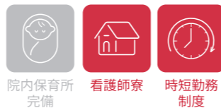
院内保育所 完備 看護師寮 時短勤務 制度

宮古病院は地域の中核病院としてあらゆる症状の患者さんを診療しています。宮古島内ですべき診療と高度医療機関に依頼するべき診療を総合的な判断で選別しながら、地域で協力し合い、長期に持続可能な地域の医療を目指しています。