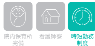
院内保育所完備 看護師寮 時短勤務制度

同圏域における地域医療「最後の砦」として、草創期から急性期医療に取り組み、24時間救急医療体制を維持しているほか、平成28年度には地域周産期母子医療センターの認定を受けるなど着実に発展を続けております。また、臨床研修の実施により若手医師の育成にも力を入れています。