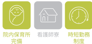
院内保育所 完備 看護師寮 時短勤務 制度

胎児期から成人までを対象とし、さまざまな疾患に対応することが可能な高度多機能な病院です。我が国の少子高齢化社会において、こどもから大人までを継続して医療サービスを受けることができるユニークな病院として注目を集めています。